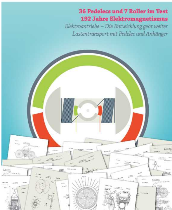
ExtraEnergy Magazin Nr. 6, Ausgabe August 2012

August 2012 5,90 € Überwachen Sie die Verfügbarkeit des Magazins unter: www.extraenergy.org